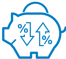
Gemiddeld rendement van 8,7%